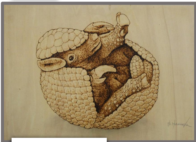
ミツオピアルマジロ