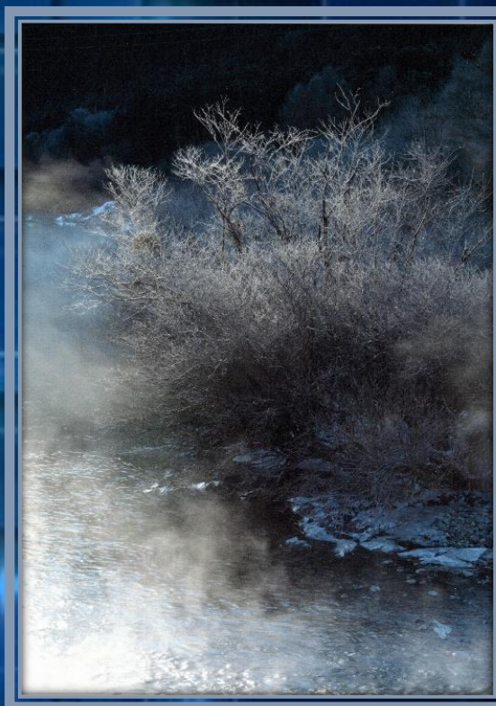
霧氷の輝き

上松町在住の原義夫さん(12点)、中林隆司さん(10点)による、 楽しい仲間「写楽」の写真展です。