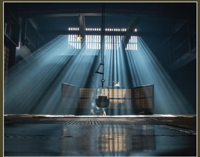
【 冬至 】

木曾写友会に所属し、木曾町を中心に活動する会員12名による写真展です。『木曾路・山紫水明』と題し、自然が織り成す四季折々の木曾路の姿をもっと皆さんに知っていただきたいと、会員の皆さんそれぞれの想いを込めた作品24点を展示します。